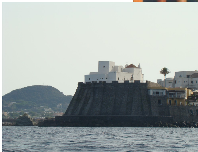
Forio "Chiesa del Soccorso"